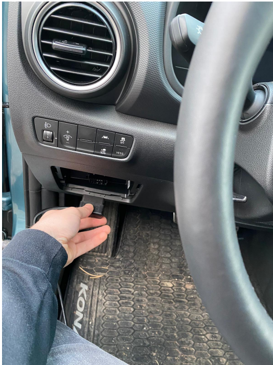
Possible position of a OBD port