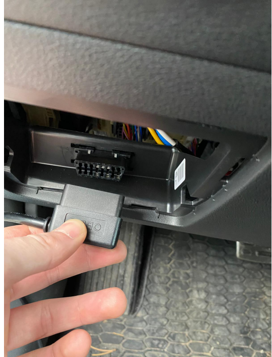
Verbindung des OBD-II-Kabels zum OBD-Port